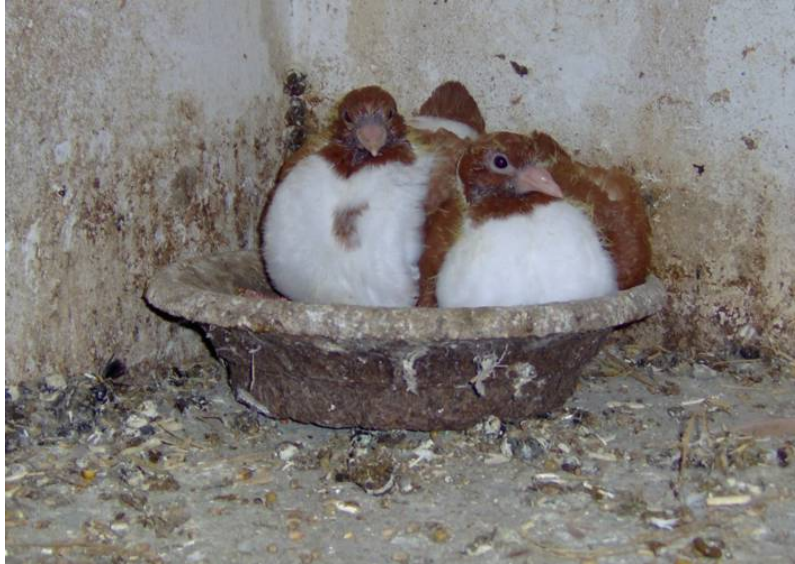
Die ersten jungen Gazzi 2008

Die züchterische Geduld hat sich gelohnt und die erste Ernte eingefahren! Die umfangreiche Bändersammlung in seinem gemütlichen Gartenhaus belegt eindrucksvoll die Qualität seiner Zucht.