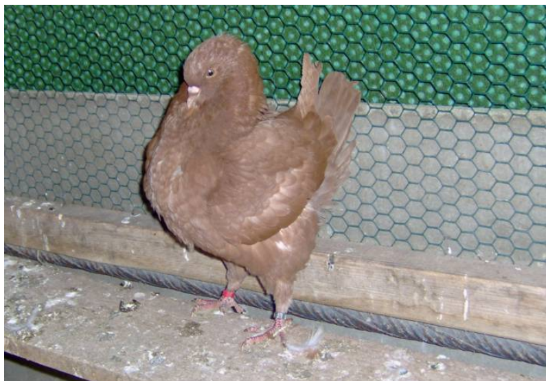
Schietti Rot 2008

Bruno hat immer ein offenes Ohr und freut sich über jeden Besuch !