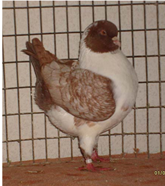
1,0 - jung – Gazzi rot-hell-schildig-gesäumt

Nach den gewonnen Erfahrungen mit der Rasse wagte ich mich 2004 an einen schweren Farbschlag, der sehr selten gezüchtet wird – Gazzi rot-hell-schildig gesäumt . Es ist schon eine züchterische Herausforderung, sich mit diesem schönen Farbschlag zu befassen. Dass ich hier auf einem guten Weg bin, zeigt mein Täuber aus 2009. Freuen würde ich mich über Kontakte zu Züchtern, die ebenfalls diesen Farbschlag als Gazzi oder Schietti züchten.