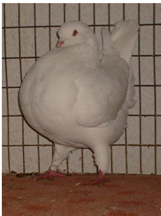
0,1 – jung - weiß

Mit den ersten Ausstellungserfolgen der Modenas stieg meine Motivation, sich mit anderen Farbschlägen dieser schönen Taubenrasse zu befassen. Also wurden 1988 Gazzi in blau und rotfahl sowie Schietti in blau mit bronze Binden, blau-bronze-gehämmert, schwarz und weiß hinzugenommen.