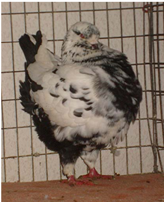
1,0 – jung – schwarzscheck

Mit den ersten Ausstellungserfolgen der Modenas stieg meine Motivation, sich mit anderen Farbschlägen dieser schönen Taubenrasse zu befassen. Also wurden 1988 Gazzi in blau und rotfahl sowie Schietti in blau mit bronze Binden, blau-bronze-gehämmert, schwarz und weiß hinzugenommen.